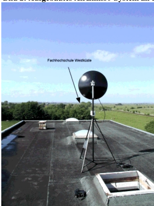
Bild 3: Blick vom Dach des Silogebäudes in Meldorf in Richtung der 12 km entfernten Fachhochschule Westküste in Heide