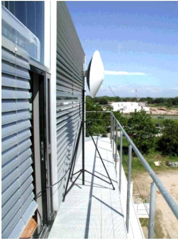
Bild 2: Aufgebautes AirLink80-System an der Fachhochschule Westküste