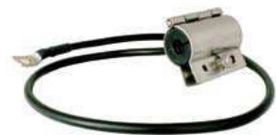
Erdungsschelle für Aircell®7, Art.-Nr. 6811

Bedingt durch Fertigungstoleranzen kann der Verlauf der Rückflussdämpfung variieren! Einzelne Spitzen sind unkritisch!